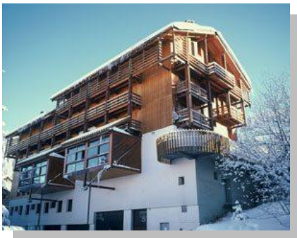
Val d'Isère (1600m)

Vous pourrez également profiter des activités alentours à prix réduits et de stages ponctuels organisés par l'ATSCAF (Golf, surf, Pilate, généalogie, photo, rando etc.) !